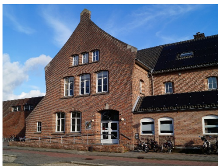
Jerusalem, Heuvelstraat 4 Venray

Voor alle deelnemers, leden van DOEN! en andere geïnteresseerden. Op deze manier willen we jullie periodiek op de hoogte houden van ontwikkelingen binnen onze vereniging.